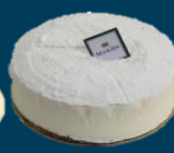
Room &amp; Kaas