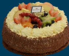
Biscuit Fruit Room