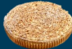
Rijst Room Nootjes